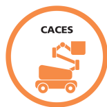
CACES R486 A